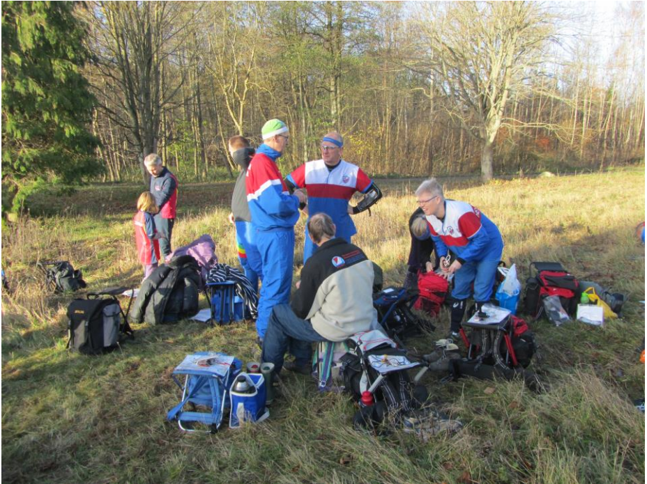
Et stemningsbillede fra vinterturneringen 2013/14