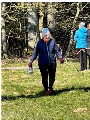
Mor Ulla kommer fint i mål

Efter maden hyggede vi med snacks, slik, gennemgang af vores løb, vin og masser af grin.