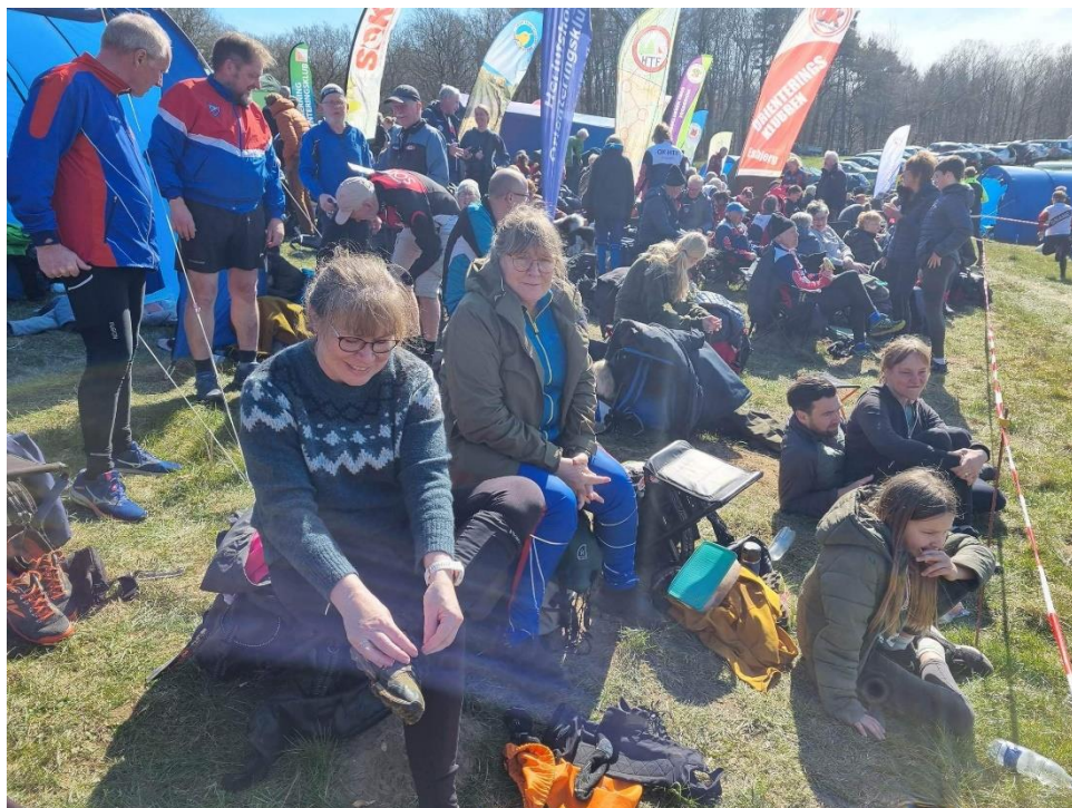
Stævneplads, Påskeløb 6/4-8/4 2023