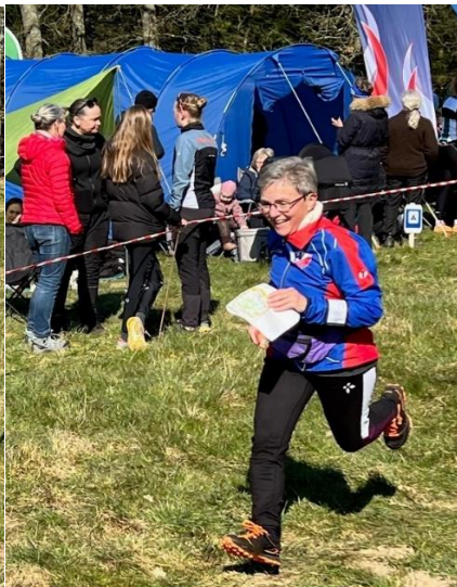
Hanne i smuk stil