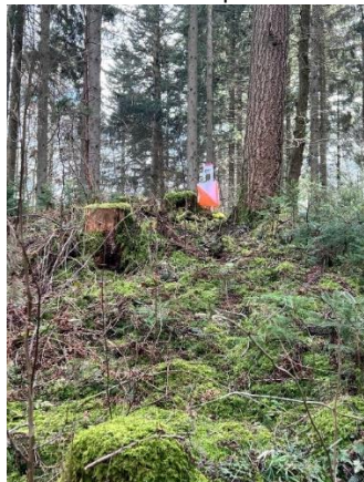
Næstsidste post oppe i højden i Ålum

Vi fik som nogen af de første fundet os en dejlig plads lige op ad opløbsstrækningen. Ålum Skov var en kuperet skov med masser af bakker op og bakker ned.