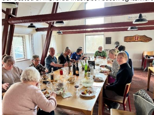
Aftenhygge i lejren

Eftermiddag og aften i lejren forløb rigtig hyggeligt med bålstemning, legende børn og dejlig mad, der bestod af mørbrad indsvøbt i bacon og lækker tilbehør.