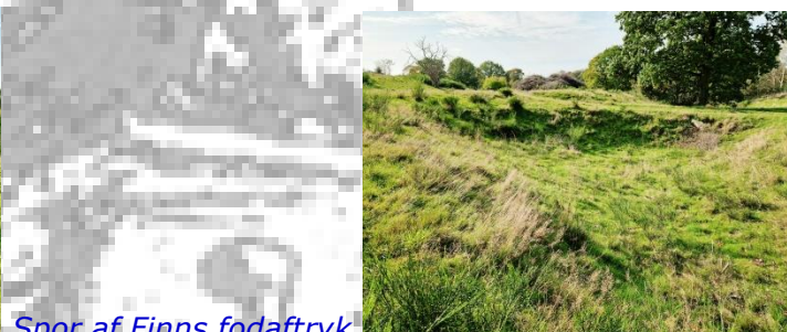
Spor af Finns fodaftryk