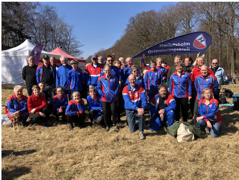
Det meste af holdet fra divisionsmatchen 8/4 2018