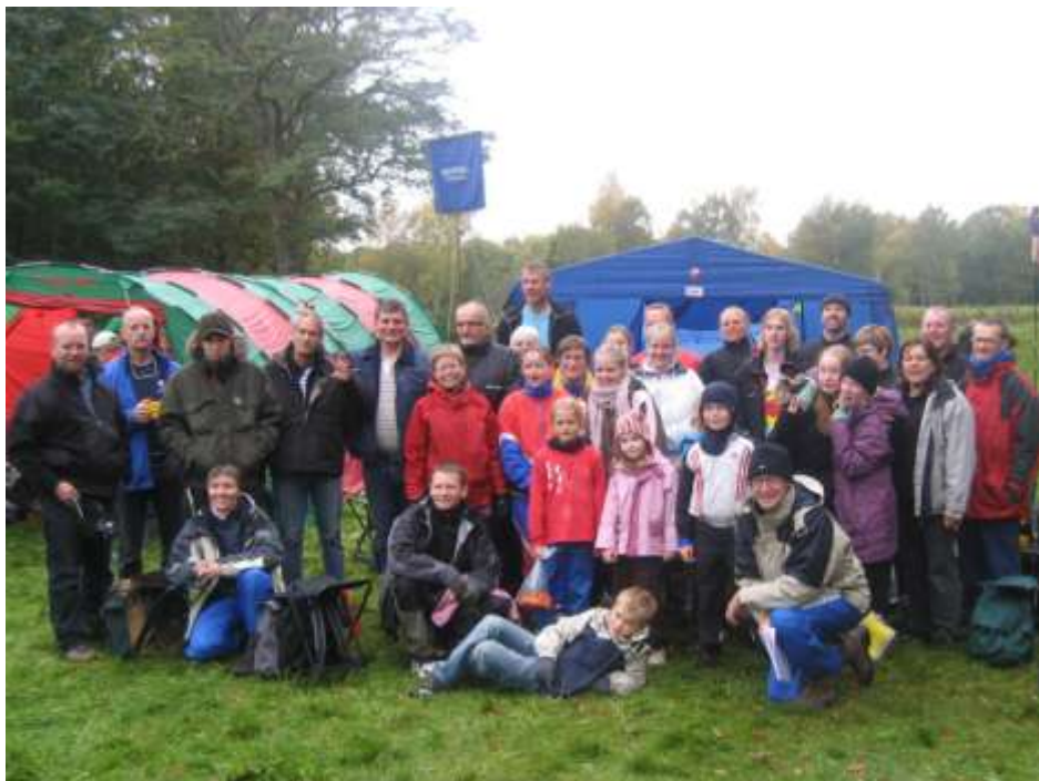
Klubbens deltagere den 11. oktober i Teglstrup Hegn

Det lykkedes os igen at slå OK Skærmen, men de to nedrykningskandidater fra var for stærk en mundfuld for os. Både OK 73 og KFIU sikrede sig forbliven i 3. division, og vi måtte tage til takke med tredjepladsen i oprykningsmatchen foran OK Skærmen.