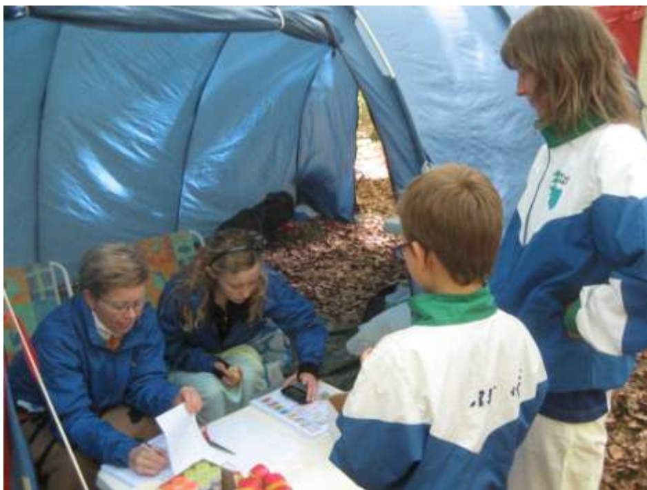
Børneaktivitetsteltet ved SM-stafet 2009

Du kan læse mere på www.jwoc2010.dk eller kik i brochuren som ligger i klubben.