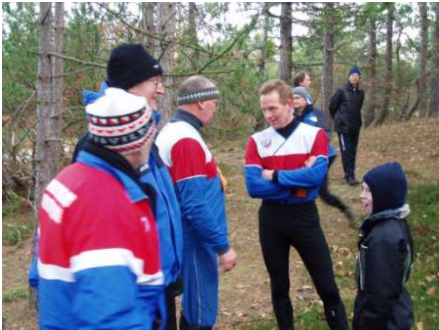
Snakken går ved Nytårsstafetten 2009

Start: Indprikning fra kl. 9.45. Søndage mellem kl. 10.00 – 11.00. Afslutningsløbet dog lørdag kl. 14.00.