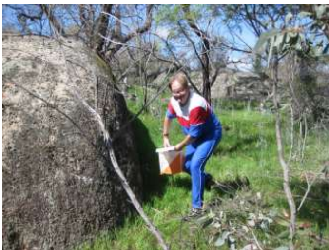
Formanden finder en post

Heldigvis var der indimellem også enkelte dage med solskin. En af dem bragte gensyn med Mount Kooyoora, som jeg tidligere havde brugt lang tid på at komme igennem (se Klubnyt fra dec. 2002). Der er tale om en nationalpark med et fantastisk smukt graniterræn. Store blokke spredt med rund hånd i landskabet. Det var en stor oplevelse at luske rundt og finde skærme i strålende solskin og forårslune 15 grader. Bagefter kravlede vi rundt mellem klipperne på den anden side af bjerget, hvor en berygtet landevejsrøver, captain Melville havde haft sit gemmested for myndighederne i en hule.