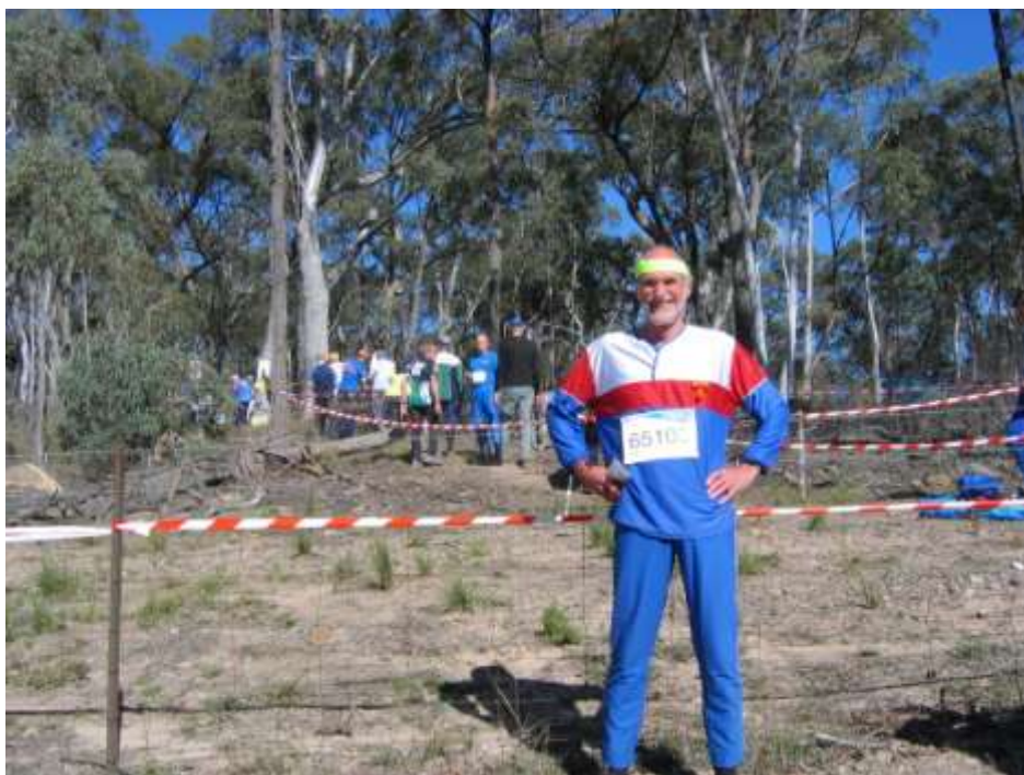
Ved starten før B-finalen